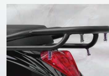
• Parrilla trasera portaequipaje