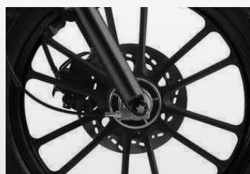
• Freno delantero de disco