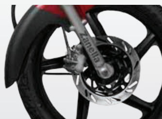
• Llanta de aleación