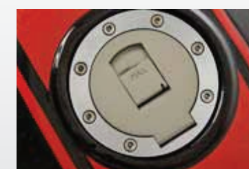
• Tapa de tanque de diseño flat