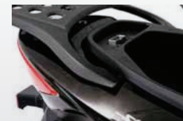
• Baúl portacasco bajo asiento