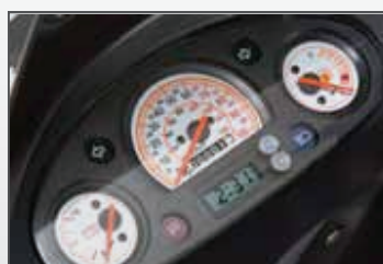
• Tablero análogo / digital completo