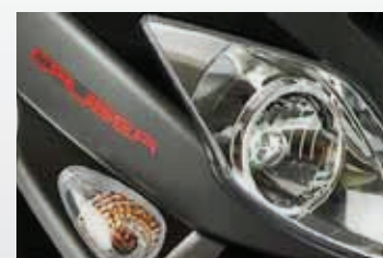
• Ópticas de diseño deportivo